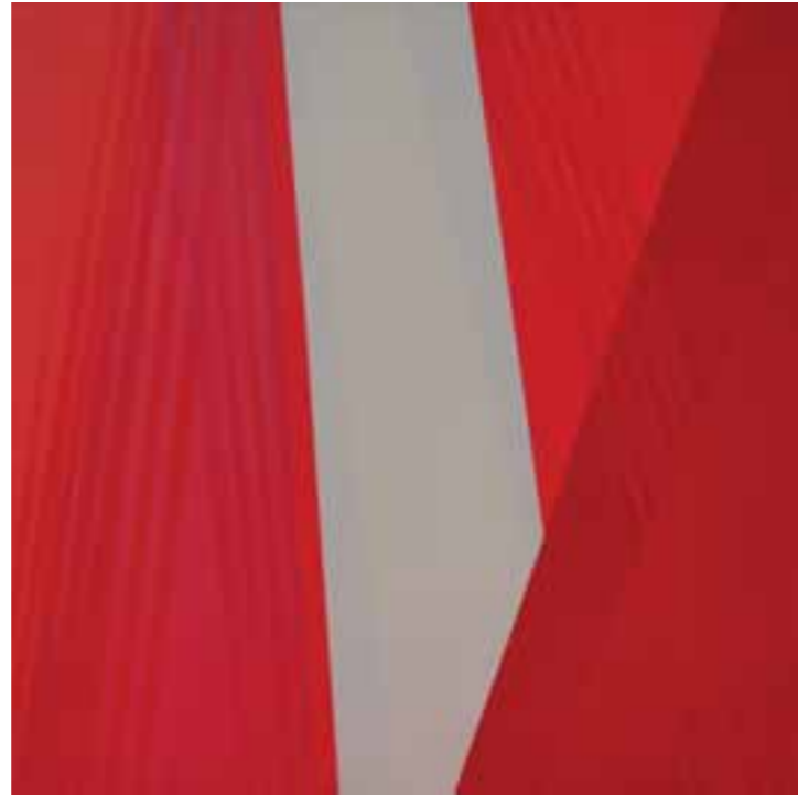
4. Apertura en Rojo II Acrílico sobre tela, 0.80 m x 0.80 m, 2012.