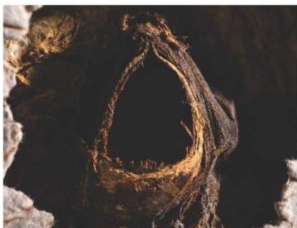
SILVIA CONTE MAC DONELL